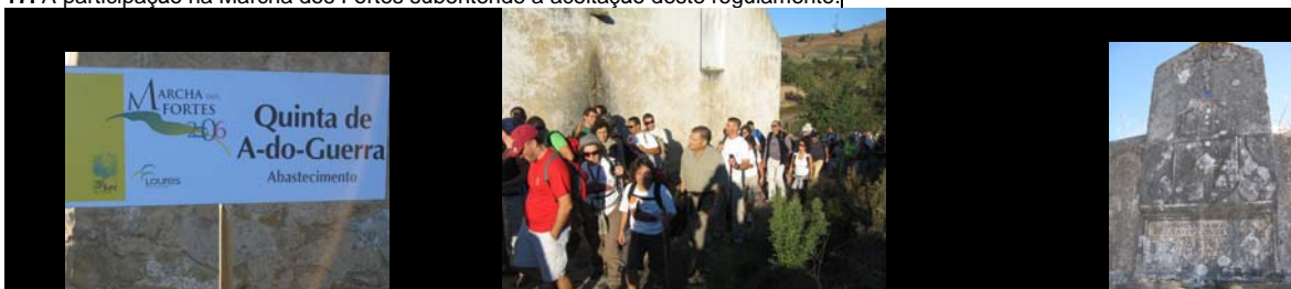
A Quinta de A-do-Guerra em 2006, em 2007 e em 1638!

17. A participação na Marcha dos Fortes subentende a aceitação deste regulamento.